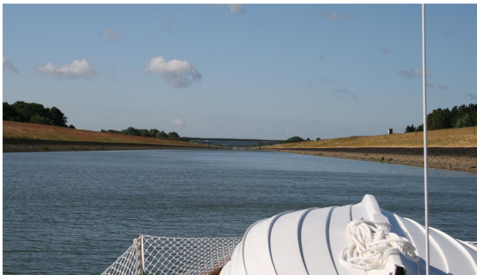
Elbe Seitenkanal. Vattenmotorväg?

Om det bara är en fråga om att komma så fort som möjligt ner till Medelhavet, behöver det inte ta så lång tid. 26 dagar från Travemünde i Nordtyskland till Port St. Louis i Sydfrankrike kan man klara det på. Men så har man inga dagar då man ligger still, och man är tvungen till att segla från det att slussarna öppnar, på morgonen, tills de stänger på kvällarna – varje dag.