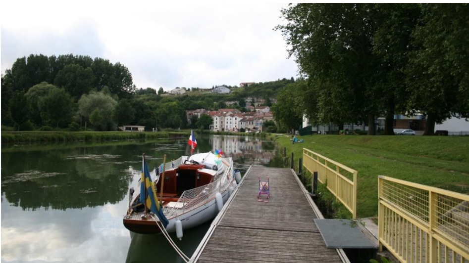
Gratis flytbrygga i Frankrike.

På kanalerna och floderna är priserna mer rimliga. Allt från gratis till € 5-15.