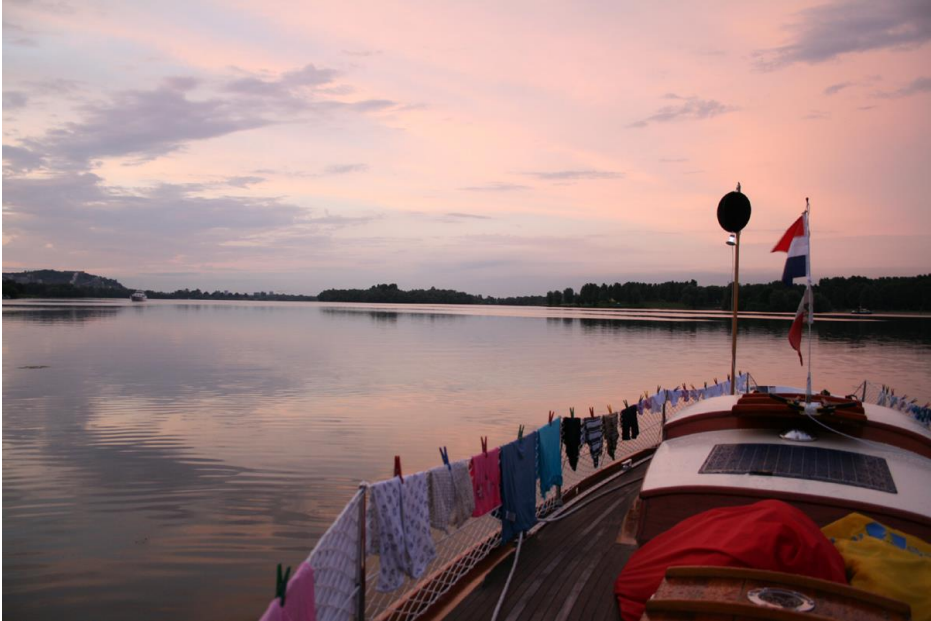
En sjö i Holland. Ankarkulan sitter i spinnackerbommen.

Flera gånger i Tyskland, och speciellt i Holland, kommer man förbi sjöar. Både stora och små sjöar. Varför inte ankra där? Det kan vara en trevlig omväxling til kanalerna och städerna. Kom dock ihåg ankarkulan och ankarljuset! Både den tyska och den holländska polisen är mycket noga med detta.