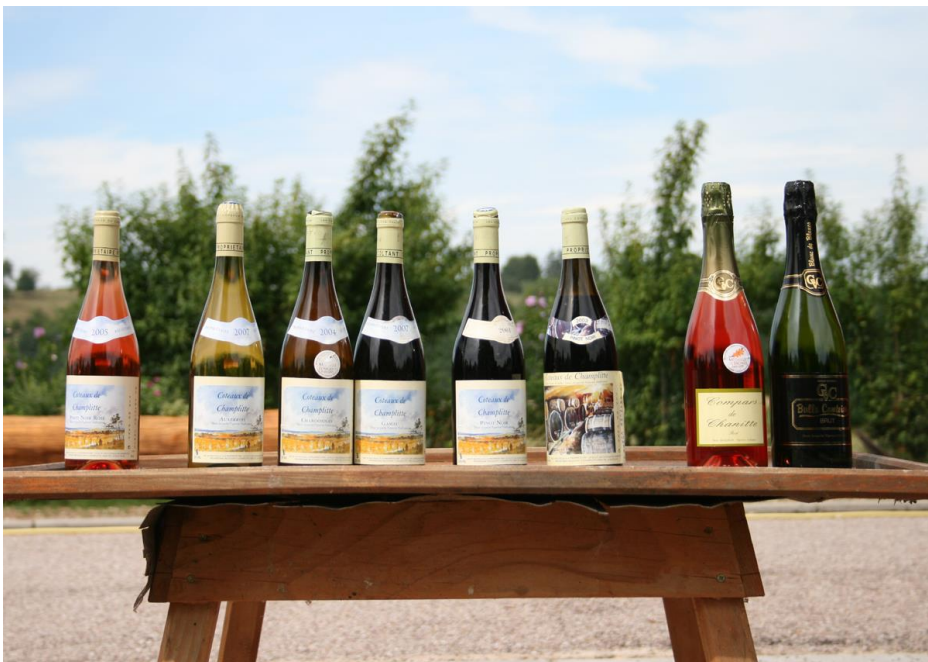
Vinförsäljning i en sluss i Frankrike

Man seglar långt ut på landet, och det är mycket lättare att få tag på vin och frukt, än det är att få tag i sjökort eller oljefilter.