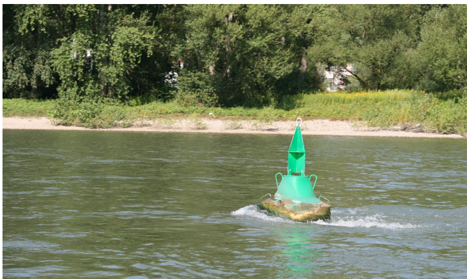
Massor av ström på Rhen. Fint på vägen hem.

Det beror en del på båten, och hur fort den kan gå för motor. Normalt vill man gärna slippa att segla mot strömmen på Rhen, för här kan strömmen vara kraftig. Vi har upplevt över 4 knops motström på Rhen. Den kan också vara ännu kraftigare.