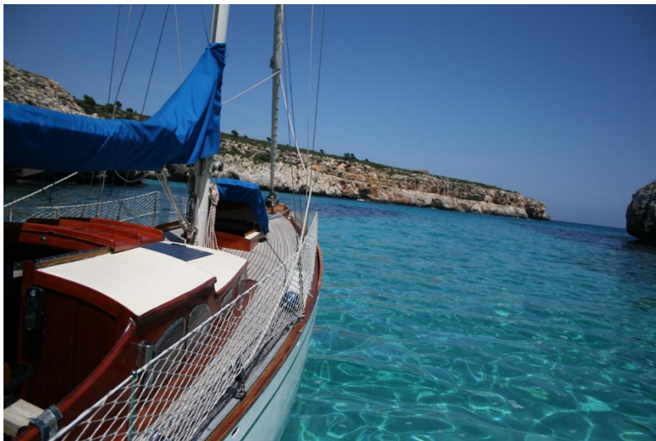
Ankarvik på Mallorca. Kan man önska mer?